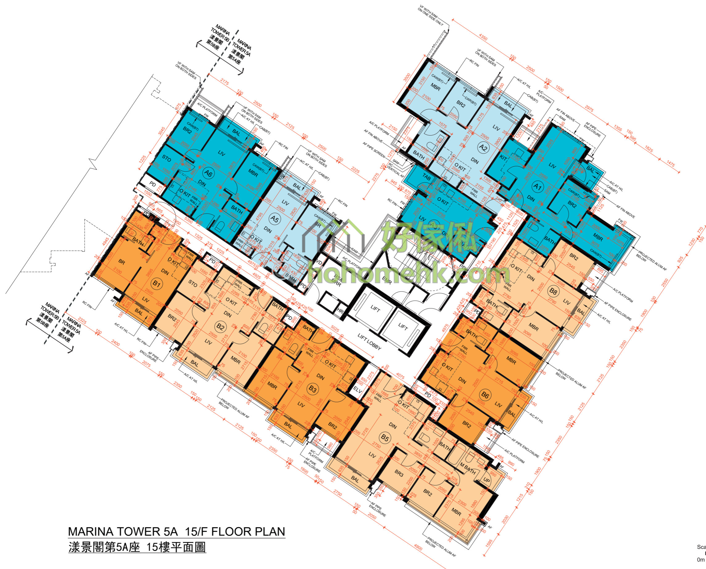
MARINA TOWER 5A 15/F FLOOR PLAN 漾景閣第5A座 15樓平面圖