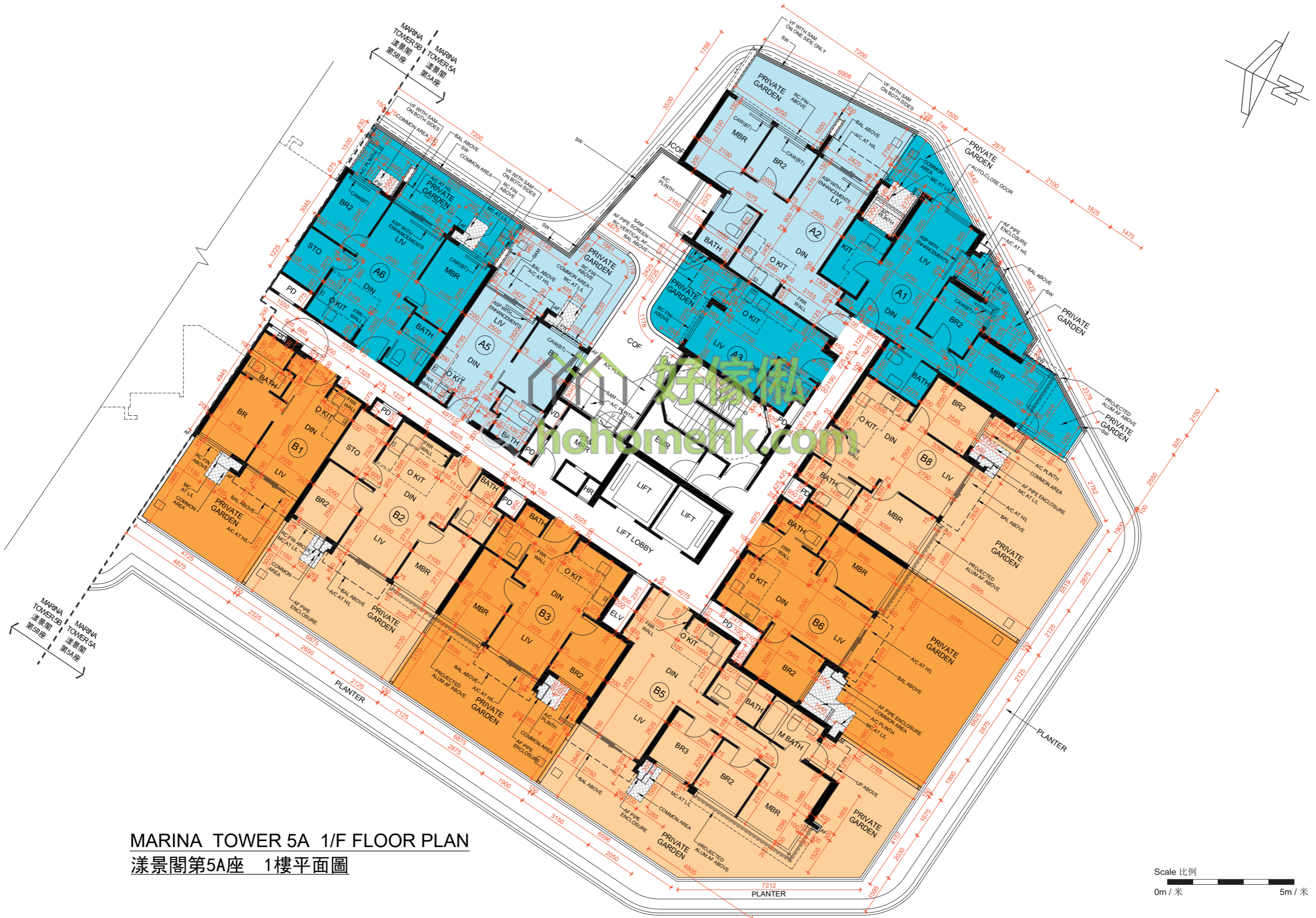
MARINA TOWER 5A 1/F FLOOR PLAN 漾景閣第5A座 1樓平面圖