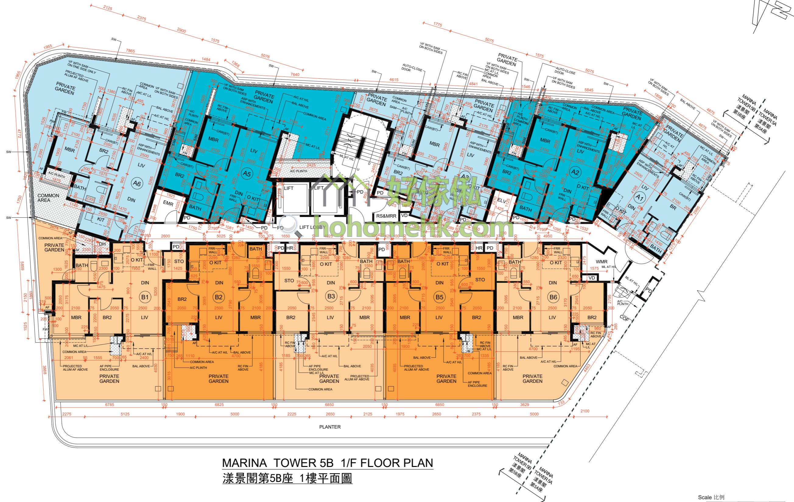
MARINA TOWER 5B 1/F FLOOR PLAN 漾景閣第5B座 1樓平面圖