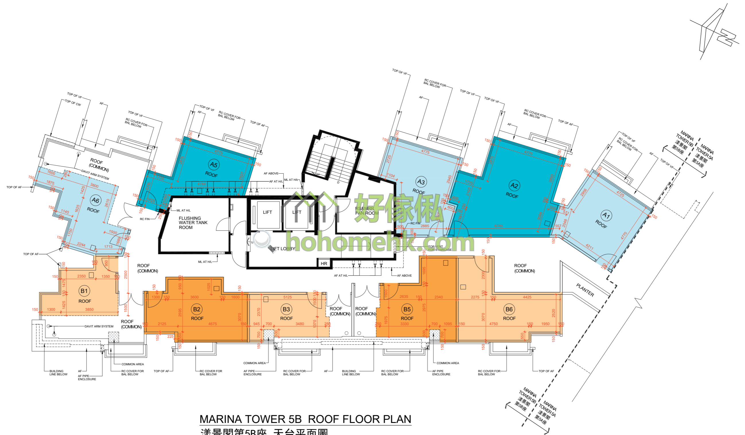
MARINA TOWER 5B ROOF FLOOR PLAN 漾景閣第5B座 天台平面圖