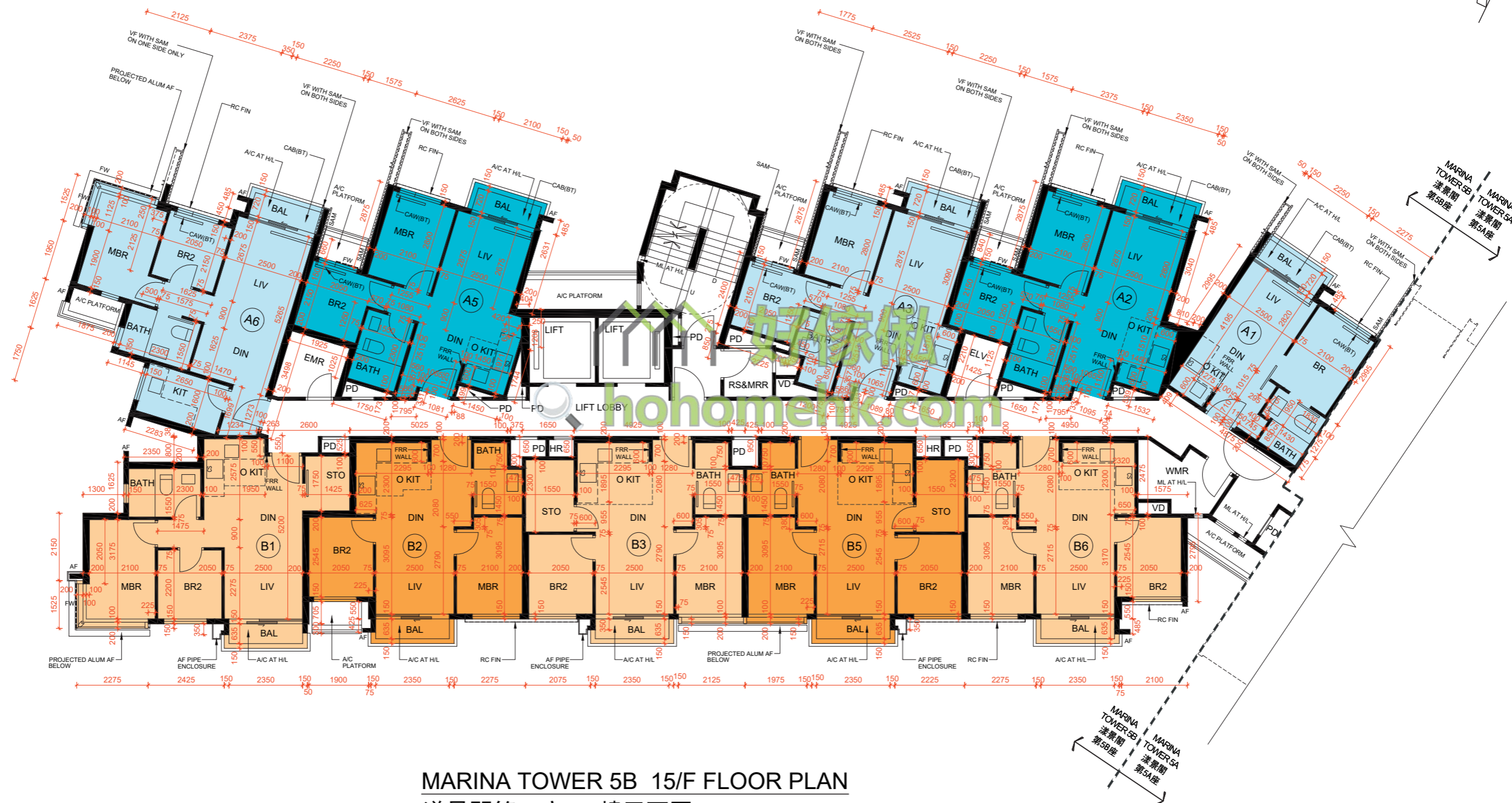
MARINA TOWER 5B 15/F FLOOR PLAN 漾景閣第5B座 15樓平面圖